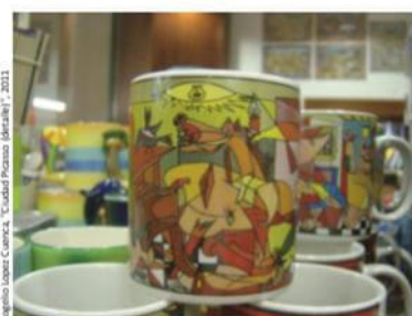
Rogelio López Cuenca, "Cuidado Puro (Series)", 2011