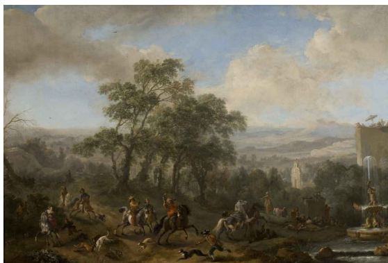
Philips Wouwerman Cacería de liebres