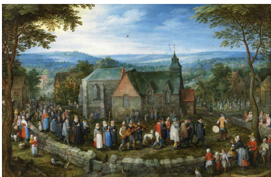
Jan Brueghel el Viejo Boda campestre

Cada pueblo tiene sus canciones y bailes típicos. Busca cómo se llaman las danzas de las diferentes regiones de España, analiza con qué instrumentos se tocan y cómo se bailan.