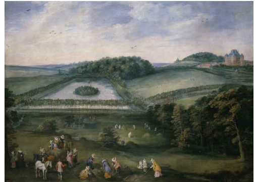
Brueghel el Viejo y Joos de Momper el Joven Excursión campestre de Isabel Clara Eugenia

En este caso se trata de un día de fiesta, por lo que los protagonistas y sus acompañantes se han puesto sus mejores galas, especialmente reconocibles en el caso de las mujeres: las gorgueras o cuellos que les dan rigidez, las faldas y sobrefaldas largas de ricas telas, etc.