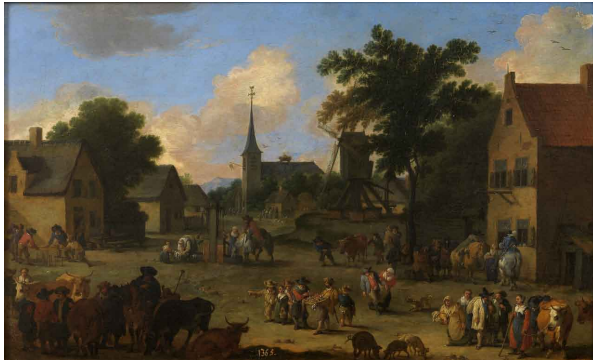
Pieter Bout La plaza de la aldea