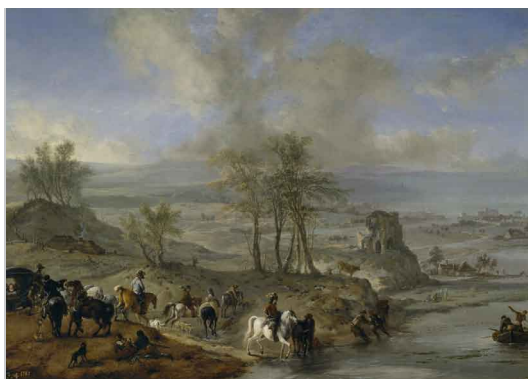
Philips Wouwerman Partida de caza y pescadores