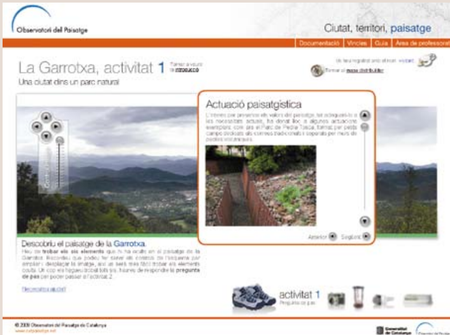
Imatge 3. Web del projecte Ciutat, territori, paisatge, dirigit a fomentar l'educació en el paisatge entre l'alumnat d'educació secundària obligatòria de Catalunya.

Les actuacions de formació i suport als especialistes previstes per la llei inclouen tant activitats de formació com l'elaboració d'instruments de gestió. En aquests àmbits, la Direcció General d'Arquitectura i Paisatge ha donat suport a diversos cursos de formació organitzats per col·legis professionals, ha participat en mestratges i cursos especialitzats organitzats per les universitats i ha organitzat jornades tècniques monogràfiques. Així mateix, ha iniciat la publicació de guies pràctiques d'integració paisatgística, de les quals s'han editat dos números ( Polígons industrials i sectors d'activitat econòmica i Horts urbans i periurbans ). A més, Guia pràctica