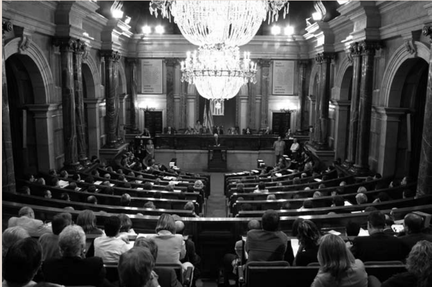
Imatge 1. El Parlament de Catalunya va ser la primera cambra parlamentària europea a adherir-se al Conveni europeu del paisatge.

nació del paisatge. Els objectius de qualitat paisatgística són la formulació que les administracions públiques competents fan, per a un paisatge concret, de les aspiracions de la població pel que fa a les característiques paisatgístiques del seu entorn. Per protecció del paisatge s'entenen les accions de conservació i de manteniment dels aspectes significatius o característics del paisatge, justificades pels valors patrimonials d'aquests últims. Segons el conveni, la gestió del paisatge són les accions destinades a mantenir-lo tot guiant i harmonitzant les transformacions induïdes per les evolucions socials, econòmiques i ambientals. En canvi, per ordenació del paisatge s'entenen les accions que tenen un caràcter prospectiu, destinades a la valoració, la restauració o la creació de paisatges.