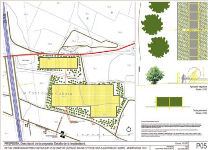
Figura 1. Detall d'un estudi d'impacte i integració paisatgística.