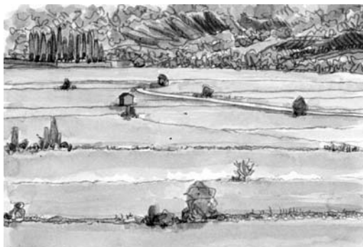
Imatges 1 i 2. A partir d'una fotografia de l'estat actual, els redactors de la carta imaginem una possible evolució del paisatge fent servir un sistema de representació accessible a tothom.