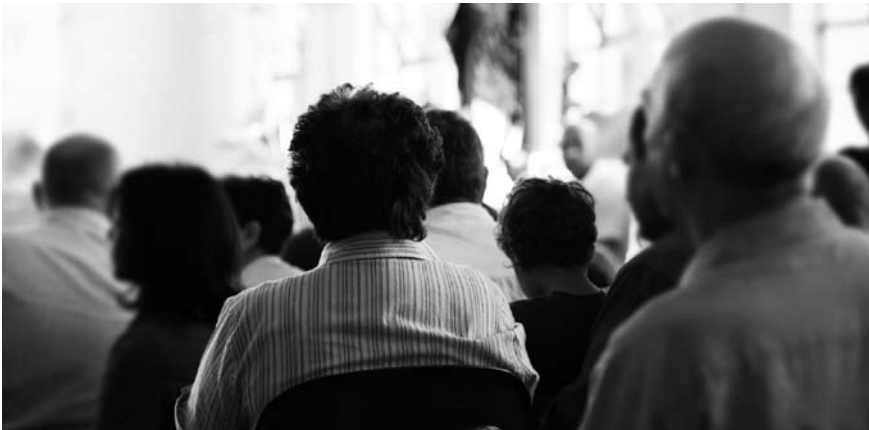
Imatge 1. La participació ciutadana és imprescindible en la definició dels objectius de qualitat paisatgística i de les estratègies d'intervenció.

L’agent o els agents que liderin el procés d’elaboració de la carta hauran d’elegir el model i els mitjans de participació tenint en compte els hàbits de consulta, les diverses organitzacions administratives, les característiques de les diferents realitats territorials, les tipologies d’instruments operatius, les escales d’intervenció i l’experiència tant passada com present, així com el grau de cultura de cooperació i participació existent en el territori afectat per la carta del paisatge. En qualsevol cas, la participació ha d’anar adreçada a tots els agents implicats: administracions públiques, població en general, societat civil organitzada (associacions, entitats i fundacions), agents econòmics, mitjans de comunicació, centres educatius i universitaris, així com als científics, artistes, professionals i tècnics més motivats pels aspectes territorials i del paisatge.