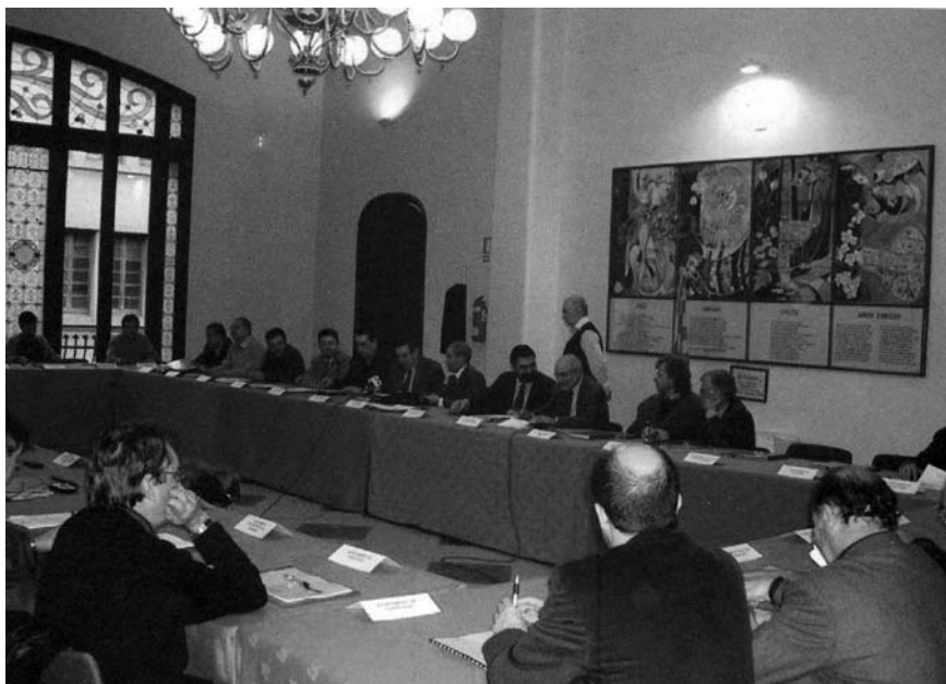
Imatge 2. Acte de signatura de la Carta del paisatge de l'Alt Penedès.

Pesca de la Generalitat de Catalunya, en el qual es va acordar redactar una carta del paisatge 2 .