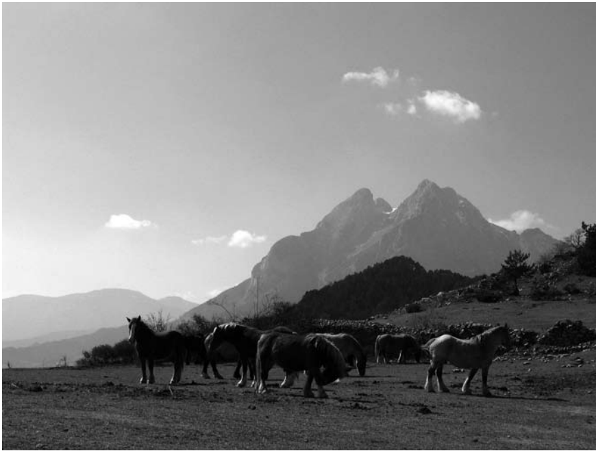
Imatge 5. Paisatge de muntanya a l'Alt Berguedà.