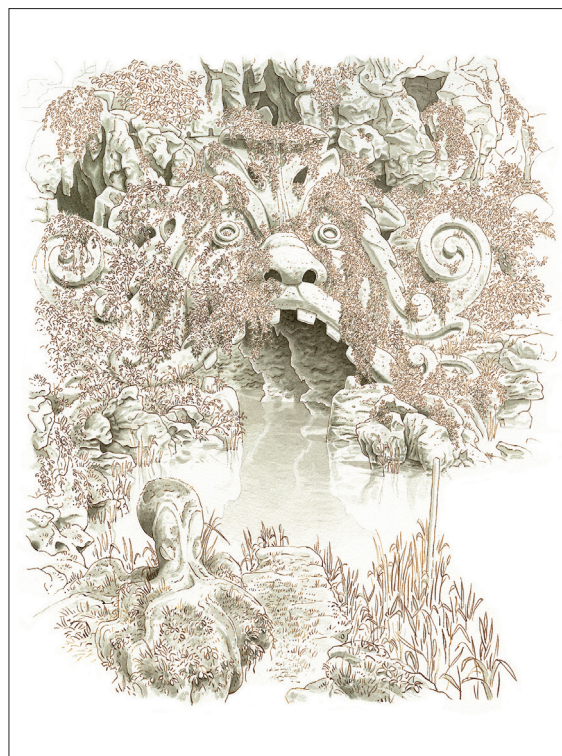
Philippe Mignon, Entrée de la grotte , dessin en grisaille

Retrouvez la publication des actes de ces XVI es Rencontres internationales dès décembre 2023