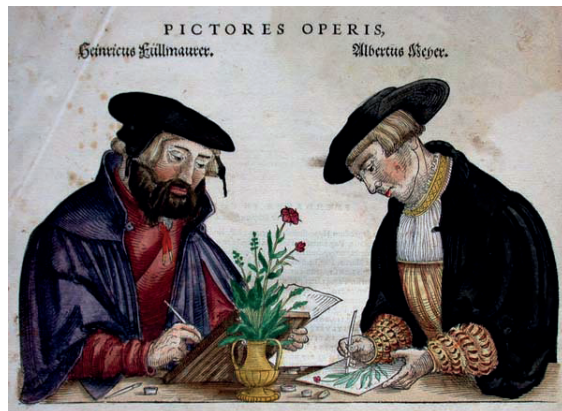
Leonhart Fuchs (1501-1566), De Historia Stirpium , Lyon, 1551, ill. p. 897, conservé dans la bibliothèque universitaire de Glasgow

Des palais du rêve aux jardins de papier