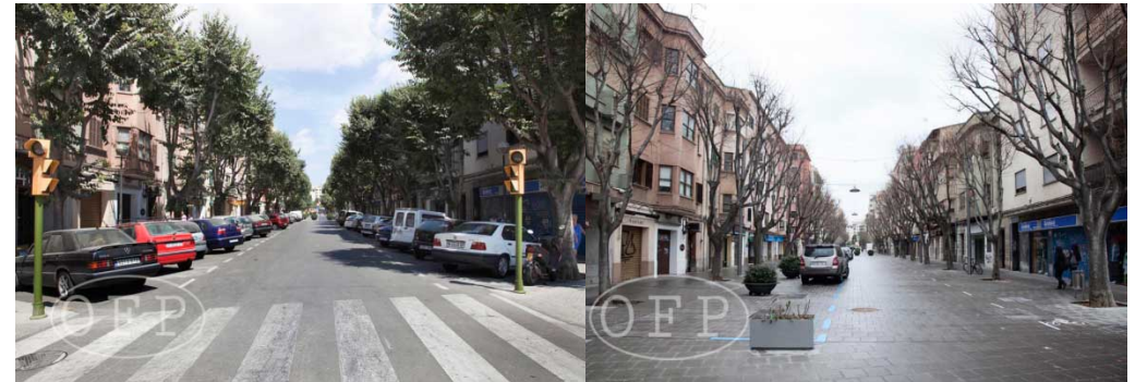
Carrer Blanquerna, Palma, 2009-2010

La web del Observatori Fotogràfic del Paisatge de les Illes Balears, gestionada por el grupo de investigación en Patrimonio audiovisual, mass-media e ilustración de la Universidad de las Islas Baleares, pretende difundir las actividades, investigaciones y proyectos en marcha para ofrecer una plataforma informativa, reflexiva e interconectada sobre la evolución del paisaje balear a través de la fotografía y otras disciplinas visuales.