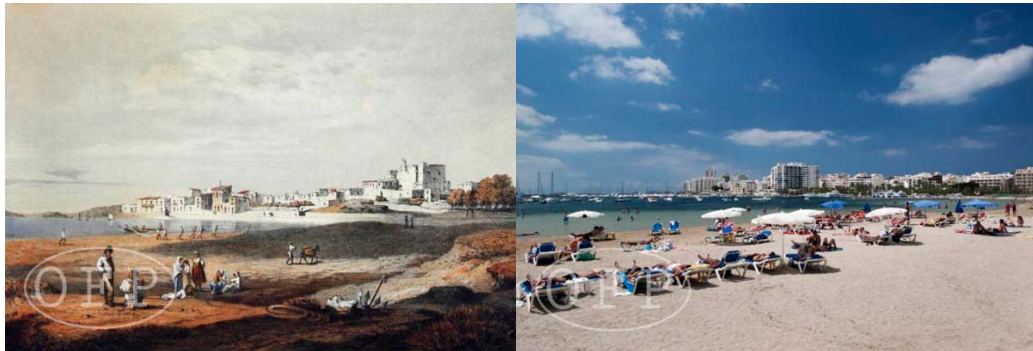
Platja de s'Arenal, Sant Antoni de Portmany, 1867-2007

La web de l'Observatori Fotogràfic del Paisatge de les Illes Balears, gestionada pel grup de recerca en Patrimoni audiovisual, mass-media i il·lustració de la Universitat de les Illes Balears, preten difondre les activitats, recerques, projectes en marxa, així com oferir una plataforma informativa, reflexiva i interconnectada sobre l'evolució del paisatge balear a través de la fotografia i altres disciplines visuals.