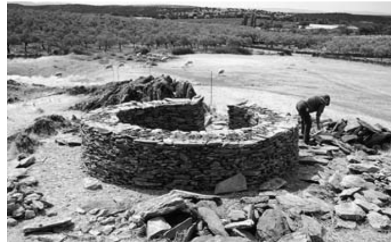
1. revista alcántara nº 58