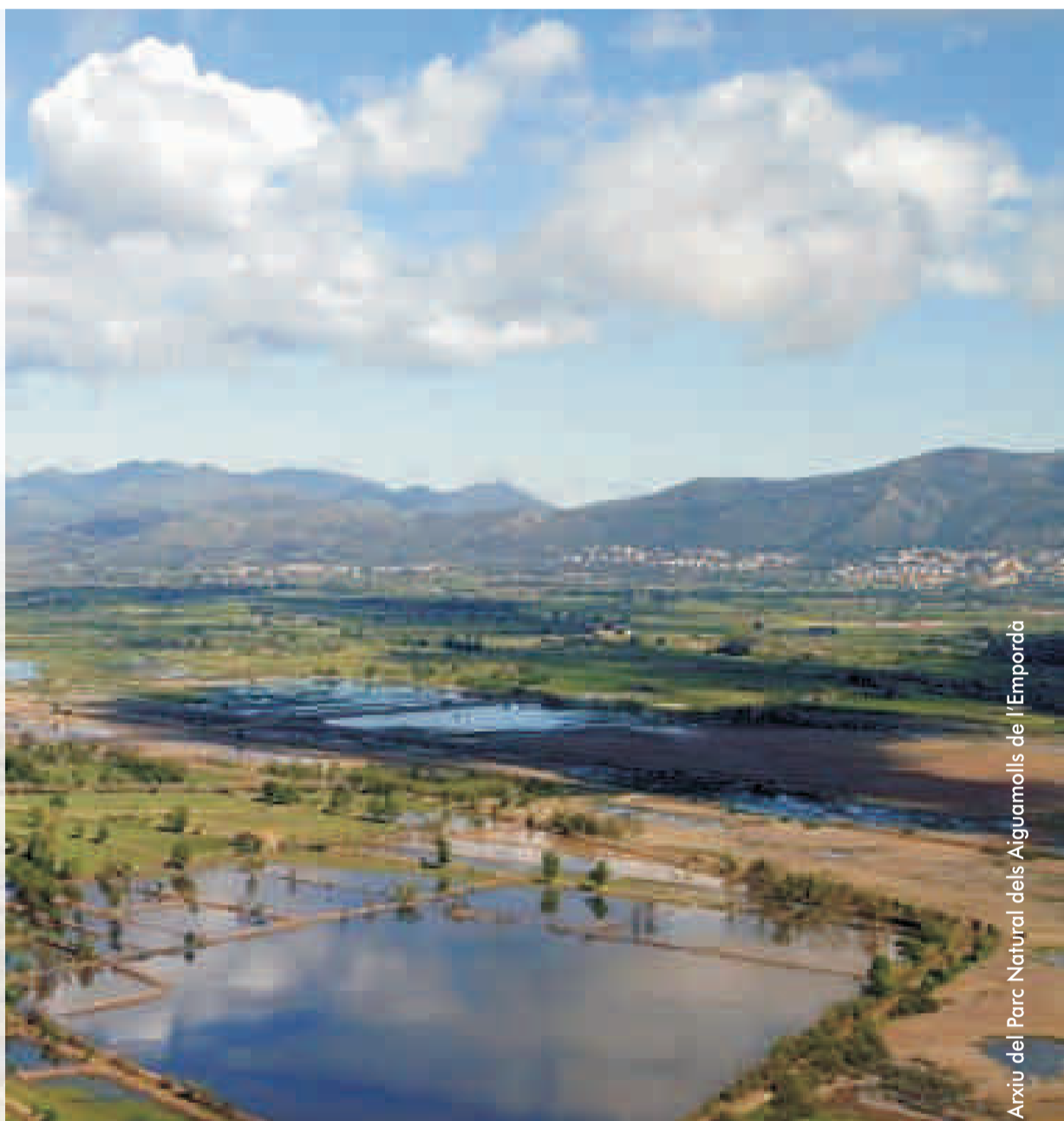
Arxiu del Parc Natural dels Aiguamolls de l'Empordà

Jornada gratuïta. Cal inscripció prèvia Els desplaçaments es realitzaran amb vehicles particulars T. 93 421 32 16 / info@associaciohabitats.cat