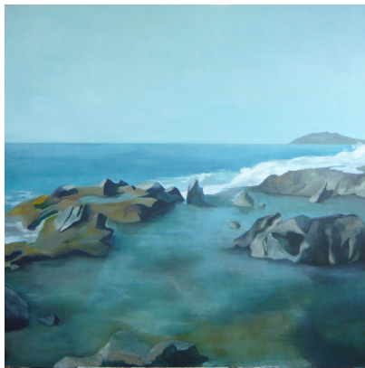
Silvia Mendoza Vera

El austero régimen de lluvias, y las temperaturas elevadas del estío convierte a este punto de la costa cálida en uno de los más duros para la supervivencia de las plantas. Aquí podemos encontrar algunas de las especies más curiosas, especialistas en supervivencia; plantas como el cornical, el aufaifo o el arto, presentes también en el norte de África, y que se han adaptado a las extremas condiciones ambientales, conformando unos matorrales singulares, difíciles de encontrar fuera de nuestra Región.